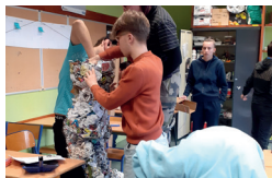
Lycée Horticole et Animalier