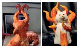
Lycée Élie Cartan