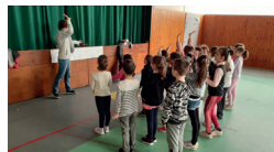
Musiciennes intervenantes des Vals Du Dauphiné