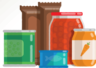
Nourriture non périssable et ne nécessitant pas de cuisson (conserves, petits pots bébé, nourriture pour animaux...)