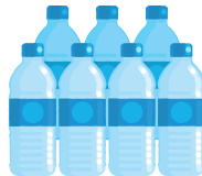
Eau potable en quantité (6 litres par personne en bouteilles)